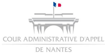
TABLEAU DES EXPERTS AUPRÈS DE LA COUR ADMINISTRATIVE D'APPEL DE NANTES ET DES TRIBUNAUX ADMINISTRATIFS DE SON RESSORT